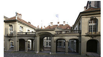
Erlacherhof, sede del consejo ejecutivo de Berna.