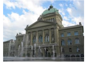
Palacio federal de Berna, sede del gobierno suizo.

Contrariamente a Zúrich , Berna incorporó dos comunas, Bümpliz , en 1919. Las negociaciones con otras, como Ostermundigen y Bolligen , han sido todas en vano. Berna se convirtió en capital federal en 1834. En 2010 dejó de ser la capital del distrito de Berna tras la disolución de este y su integración en el nuevo distrito administrativo de Berna-Mittelland .