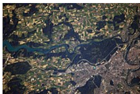
Vista satelital de la ciudad

Berna está ubicada geográficamente en la zona del Mittelland , en la meseta suiza . La ciudad se limitaba a su centro histórico encerrado entre un meandro del Aar y los muros de la ciudad hasta 1834. Con la apertura de los muros y la construcción de puentes para atravesar el río, la ciudad se expandió en todas direcciones. La ciudad limita al norte con las comunas de Frauenkappelen , Wohlen bei Bern , Kirchlindach , Bremgarten bei Bern , Zollikofen e Ittigen , al este con Ostermundigen y Muri bei Bern , al sur con Köniz y Neuenegg , y al oeste con Mühleberg y está situada en el distrito administrativo de Berna-Mittelland .