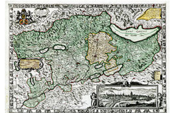
Extensión máxima de la ciudad-estado de Berna.

La Constitución de 1831 quita toda preponderancia a la ciudad de Berna sobre el cantón. Se constituyó una comuna política en 1832; todo ciudadano domiciliado y que poseyera una cierta fortuna, tenía derecho a votar. El número de electores fue creciendo gracias a la fuerte inmigración y a las leyes federales y cantonales promulgadas en 1852, 1859 y 1861, que extendían el derecho de voto. Las mujeres obtuvieron la igualdad política en 1968 y la mayoría del Consejo Comunal de 1993 a 1996. La edad de derecho al voto pasó de 20 a 18 años en 1988.