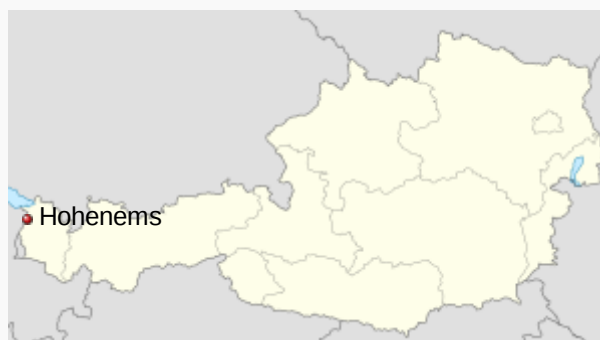
Localización de Hohenems en Austria