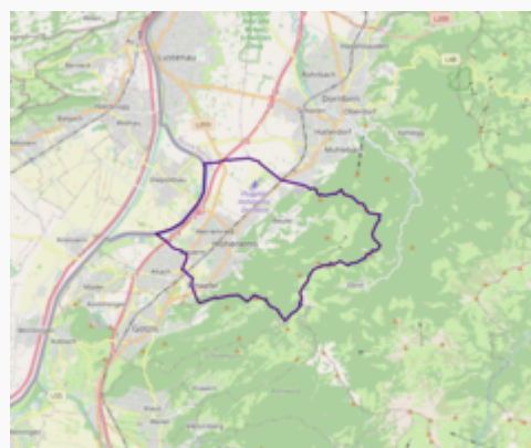
Ubicación de Hohenems