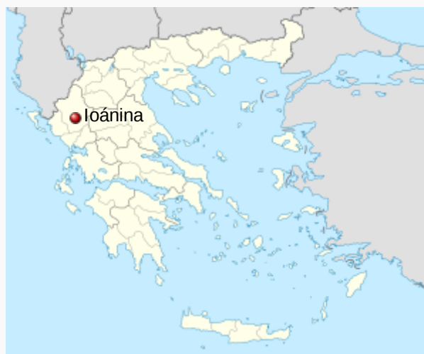
Localización de Ioánina en Grecia