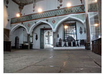
Interior de la mezquita de Aslan Aga, Museo de historia y folclore.