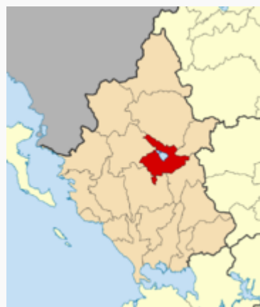
Ubicación de Ioánina