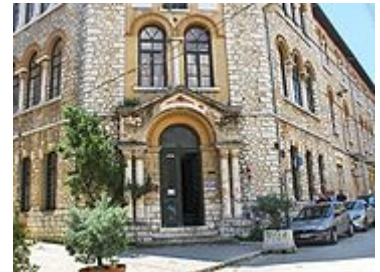
Escuela Kapláneios, refundada en 1805 .

Alí Pachá rompió, pues, con el Imperio otomano en marzo de 1820 y creó su propio reino, lo que le llevó a enfrentarse con el sultán, 3 cuyas tropas pusieron fin a su vida el 5 de febrero de 1822 en el monasterio de Pandelímon , en la isla del lago Pamvótida . 3 Mientras el sur de Grecia se independizaba tras la Guerra de independencia de Grecia , Ioánina entró en un periodo de decadencia. En 1869 una parte de la ciudad quedó destruida por un incendio, aunque se reconstruyó con prontitud.