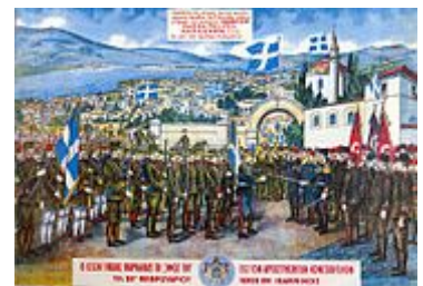
Litografía que representa la entrega de Ioánina a Grecia en 1913 .