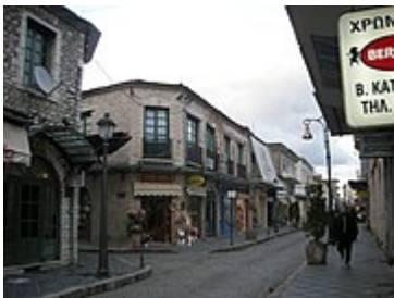
Calle del centro de Ioánina, que todavía conserva cierto aire turco. 3

En el 1318 el control de la ciudad volvió a manos de los bizantinos. Terminaron así el Despotado y la dinastía Comneno . Pero poco después, en 1339 , la soberanía bizantina quedó interrumpida por la ocupación serbia. En 1431 , tras la muerte de Carlos I Tocco , conde de Cefalonia y Zante y entonces soberano de la ciudad, ésta se sometió a los turcos, bajo el mando de Sinán Pachá . Al parecer, fueron los propios habitantes los que se la entregaron, obteniendo a cambio notables privilegios. Comenzó así el periodo de dominación turca, que se prolongó 482 años , hasta 1913 .