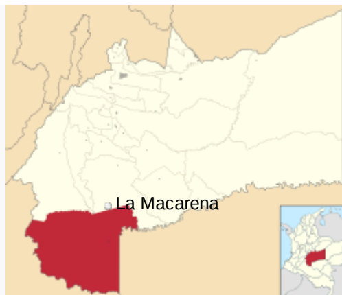
Localización de La Macarena en Meta

A mediados de los 1970s era Inspección de Policía de San Juan de Arama, en 1974 por la ordenanza N°. 021 se le otorgó la categoría de Municipio.