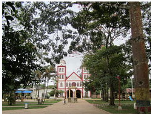
Iglesia de La Macarena.