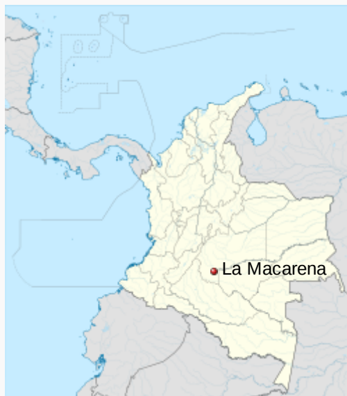
Localización de La Macarena en Colombia