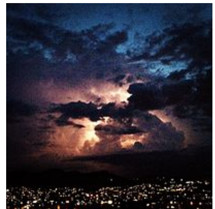
Panorama urbano tormentoso en Atizapán de Zaragoza.