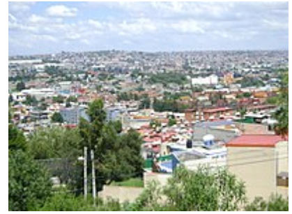
Mancha urbana de Atizapán de Zaragoza.

En este municipio existen pequeñas pero no poco importantes zonas industriales, que albergan a empresas mexicanas que del total de sus empleados un 80% viven dentro del municipio.