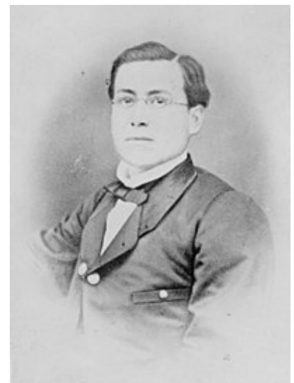
El municipio lleva el nombre del héroe nacional Ignacio Zaragoza .