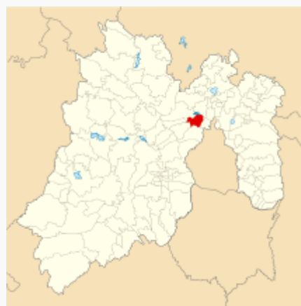
Ubicación de Atizapán de Zaragoza