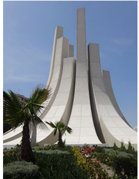
Plaza de la democracia, ubicada en la avenida Adolfo López Mateos, principal vía de acceso al municipio.

En el Código Osuna , aparece como tributario el pueblo o provincia de Cahuacán o "lugar de águilas y árboles" (situado unos kilómetros al oeste de Atizapán, en el municipio de Nicolás Romero), lo que hace suponer que los pueblos asentados en el territorio actual del municipio, tributaron junto con el cacique Machtuc, esa provincia, de la cual debieron posiblemente formar parte. También se encuentran el glifo de Teocalhueyacan que en el siglo XVI era cabecera de los pueblos que actualmente forman parte del municipio de Atizapán. Este pueblo fue fundado 500 años antes de la llegada de Hernán Cortés y sus soldados. La primera referencia que se hace sobre Atizapán, en la historia escrita, es durante el recuento de la batalla de la Noche Triste y refiere que, en su huida de los ejércitos mexicas rumbo a Tlaxcala , los españoles llegaron a Popotla y de ahí se dirigieron a Totoltepec . En su camino fueron alcanzados por un rayo azul y un ejército otomí de Teocalhueyacan quienes, resentidos contra los mexicas , a quienes tributaban, creían que aliándose con Cortés podrían liberarse del yugo de Tenochtitlan .