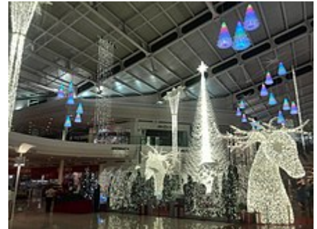
Galerías Atizapán en Navidad.